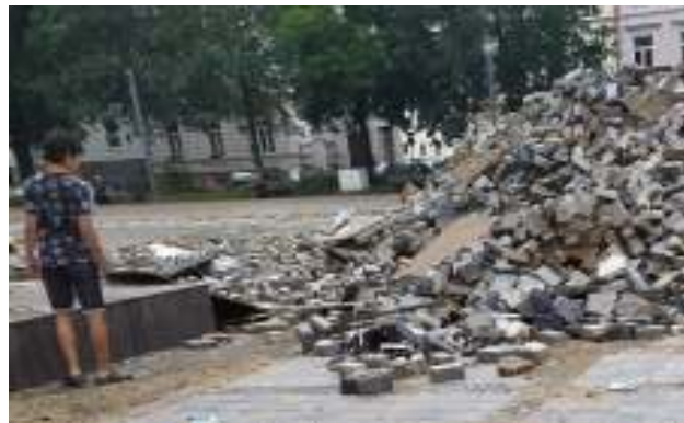
Eindrücke von den Zerstörungen in Stolberg in der StädteRegion Aachen.