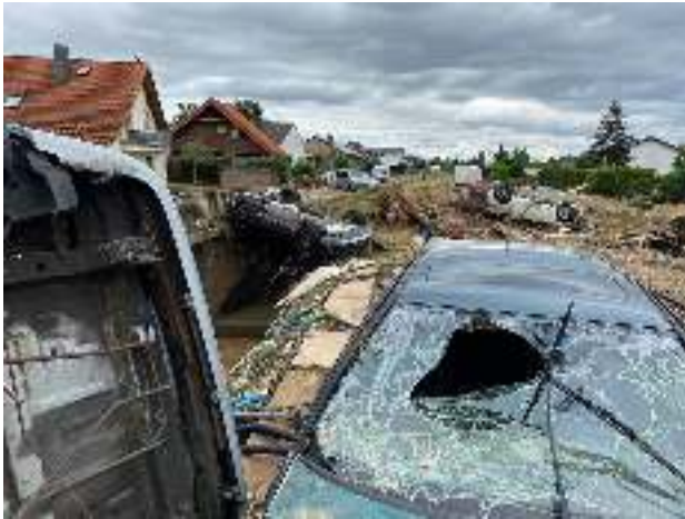
Eindrücke von der Zerstörung in Odendorf/Swisttal im Rhein Sieg Kreis.

unter anderem über die Notwendigkeit einer genderspezifischen Sichtweise auf Flucht, die Bedeutung der Resilienz und der Unterschiede bei der Traumaverarbeitung und die ressourcenorientierte Arbeit mit der Zielgruppe, welche einen wichtigen Erfolgsfaktor bei der Arbeit mit von Krisen betroffenen Menschen darstelle.