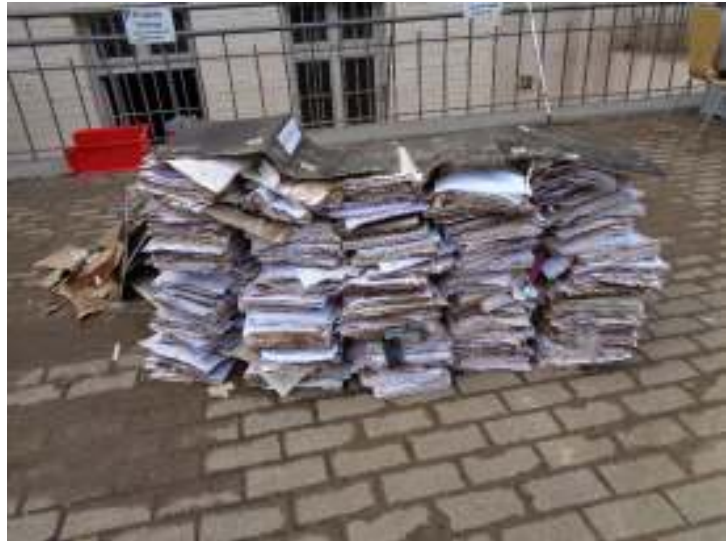
Eindrücke von den Zerstörungen im SPZ Stolberg in der StädteRegion Aachen.

besonders half in dieser Zeit, war die Solidarität zwischen den Menschen vor Ort. Viele dieser Menschen waren getragen von dem Wissen, dass jede*r Einzelne ein Stück zum Wiederaufbau beitragen kann. Besonders wichtig für sie war, in die Handlungsfähigkeit zu kommen, das Gefühl der Ohnmacht abzuschütteln und zum/zur Akteur*in zu werden.