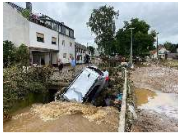
Eindrücke von der Zerstörung in Odendorf/Swisttal im Rhein Sieg Kreis.

Mitte Juli 2021 ereignete sich die Hochwasserkatastrophe in NRW und Rheinland-Pfalz, von der Menschen im nahezu gesamten Gebiet des LVR direkt oder indirekt betroffen waren. Gravierende Erlebnisse wie der Verlust von Angehörigen oder Freunden, große materielle Einbußen bis hin zum Verlust des eigenen Zuhauses können auch zuvor gesunde Menschen traumatisieren oder bereits