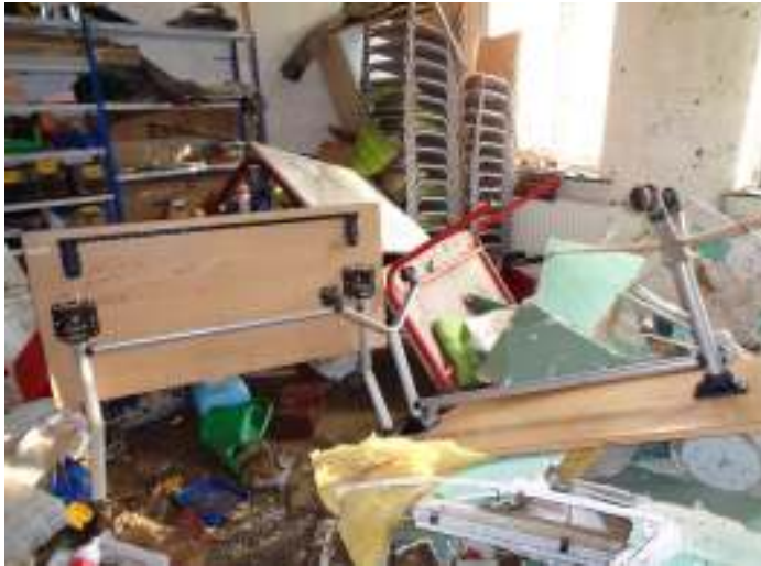
Eindrücke von den Zerstörungen im SPZ Stolberg in der StädteRegion Aachen.